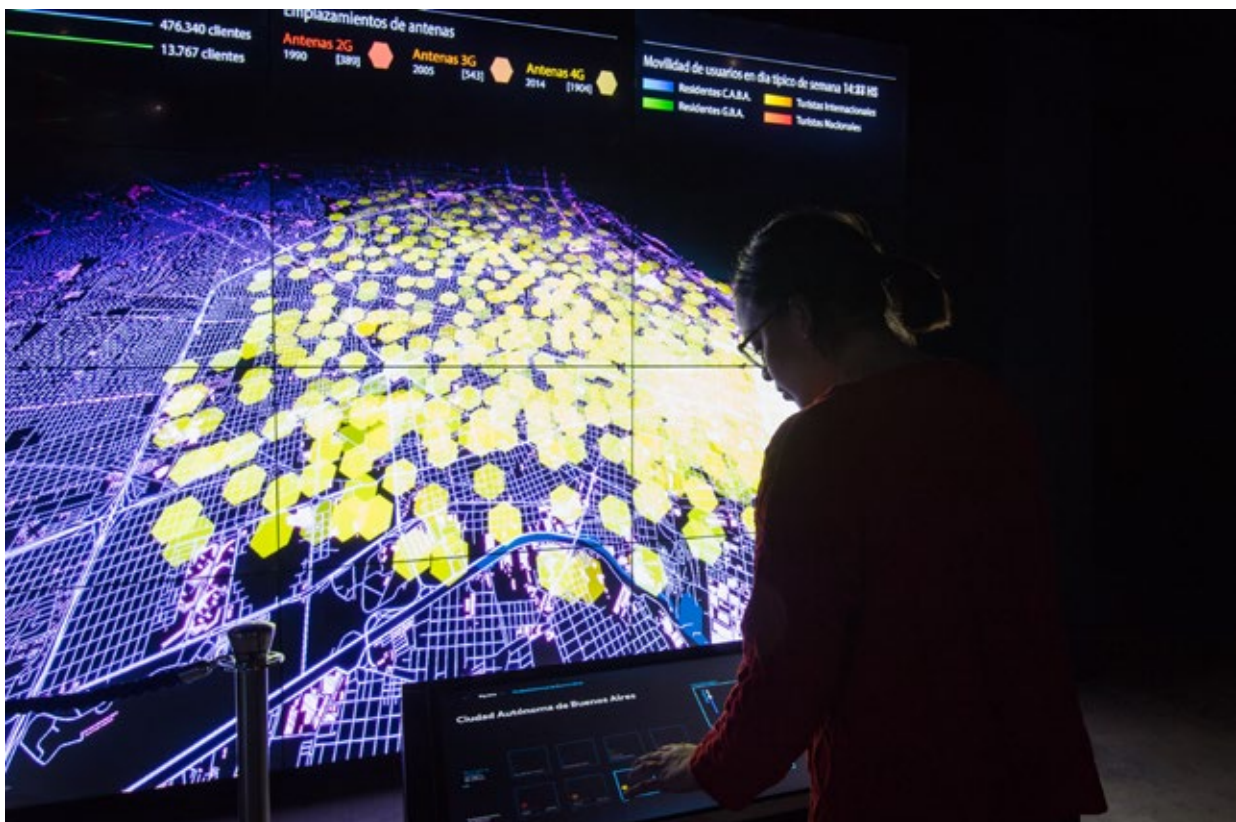
Videowall infraestructura tecnológica y mapa de calor de la Ciudad de Bs.As.

Buenos Aires, 23 de abril de 2019 - Fundación Telefónica Movistar presenta la nueva exposición "Conectados. Una mirada a la tecnología que nos conecta", la cual podrá visitarse con entrada libre y gratuita en Arenales 1540 (CABA), desde el 24 de abril al 7 de diciembre, de lunes a sábados de 14 a 20:30 hs.